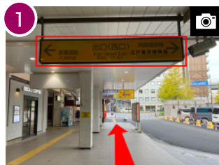
西口改札を出て、そのまま直進します。