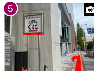
「炭焼ステーキに」の隣の建物がホテルのある「ヒューリック両国リバーセンター」です。