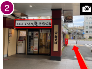
「いろり庵さらく」を左手に見ながら、その先まで進みます。