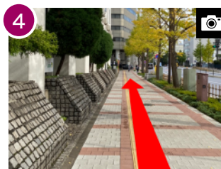
右折したら、160m 程直進します。(約 2分)