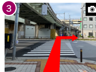
横断歩道を2つ渡り、右手へ進みます。