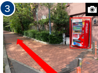
「江戸東京博物館」の駐車場の隣にある歩道に入ります。自動販売機が目印です。