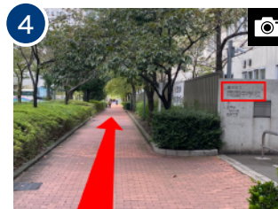
歩道を直進します。(約 3 分) 右手に「両国中学校」があります。