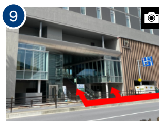
「両国子育てひろば」を通り過ぎ、階段・エスカレーター・エレベーターにて 2 階に上がり、ホテルのロビーにお越しください。