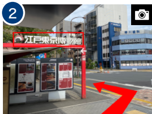
地上に上がると「江戸東京博物館」の看板が見えるので、左手へ進みます。