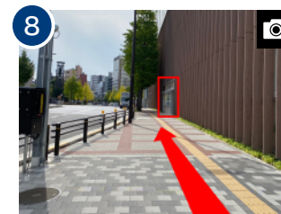
左手に直進します。(約 1 分) 右手に見える建物が、ホテルのある「ヒューリック両国リバーセンター」です。