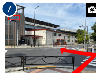
「両国国技館北」の標識のある「国技館通り」まで出たら、右手にある横断歩道を 2 つ渡り、向かい側へ進みます。