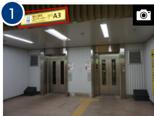
改札を出て、正面の A3 出口のエレベーターで地上に上がります。