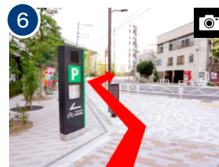
左手にある「アパホテル」の建物沿いに 200m 程進みます。